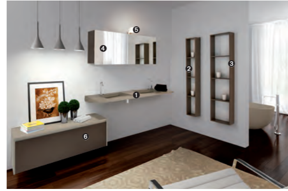
FLOW 10 pag 8-9 1 art. FLOW 07 cm. 160x51x8 h 2 art. MT701 cm. 22x16x155 h 3 art. MT703 cm. 38x16x155 h 4 art. FLS26 cm. 140x20x54 h 5 art. FX1 cm. 10x14x4 h 6 art. MT305 cm. 120x40x40 h