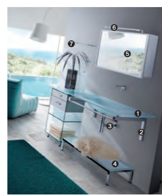
TIFFANY 760 pag 33 1_art. BCT-12/150 cm 150x57,5x1,5h 2_art. BCS-4A/80 cm 80x54x2,8h 3_art. S700 4_art. MA10-92 cm 92x36x16h 5_art. MA22/80 cm 80x17,5x55h 6_art. CAS2 cm 60x9x3h 7_art. BC-8 cm 50x12x1h