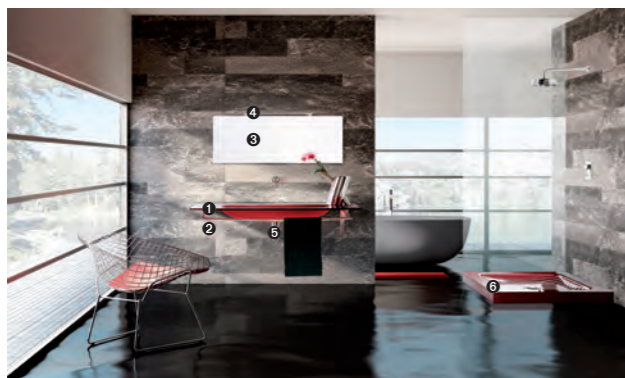
TIFFANY 740 pag 20-21 1_art. BCT-15/130 cm 130x59x1.6h 2_art. BCS-4/130 cm 130x49x2.5h 3_art. BC-5 cm 115x2x50h 4_art. CAS2 cm 60x9x3h 5_art. S700 cm 50x50 6_art. PO/02A cm 90x90x8.5h