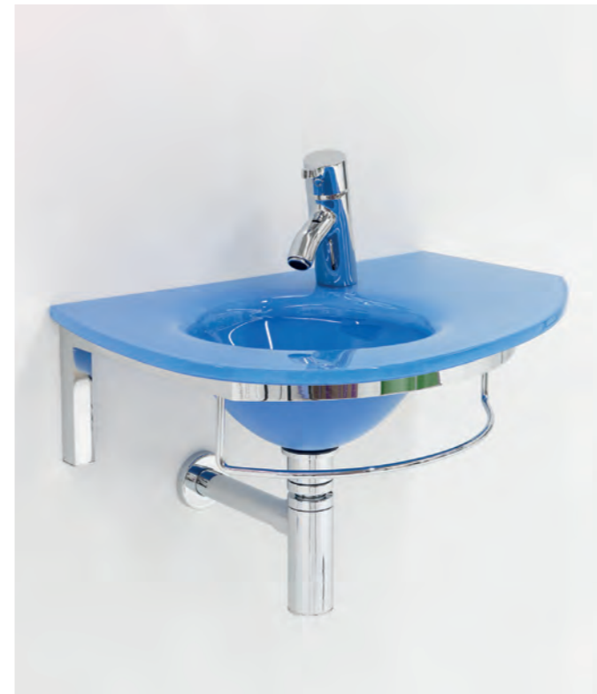
UNIK 8 cm 60x41,5