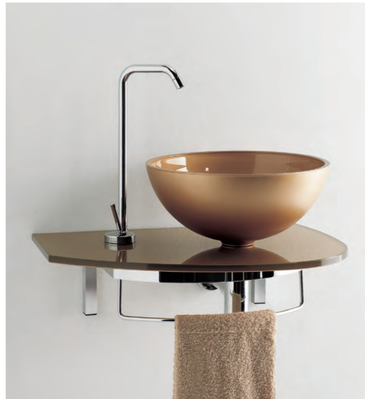
UNIK 3 cm 60x41,5

La collezione Unik si compone di pratiche consolle in cristallo per piccoli spazi. Pensate appositamente per inserirsi in spazi ridotti, propongono colori brillanti e finiture particolari come oro, argento o rame. Nella versione sopra piano o integrata creano soluzioni semplici ed esteticamente soddisfacenti. The Unik collection consists of practical crystal consoles for small spaces. Conceived especially for installation in small spaces, they propose bright colours and special finishes, like gold, silver and copper. The version for installation over the top and the built-in version create simple and aesthetically pleasing solutions. La collezione Unik est constituée de consoles en verre pratiques pour les petits espaces. Spécialement conçues pour s'adapter aux espaces réduits, elles se déclinent dans des coloris brillants et présentent des finitions particulières, comme l'or, l'argent et le cuivre. Dans la version sur plan ou intégrée, elles créent des solutions simples et satisfaisantes au niveau esthétique.