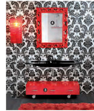
TIFFANY 790 pag 29 1_art. BCT-14/120 cm 120x5.5x1.6h 2_art. BCS-4A/120 cm 120x54x2.8h 3_art. MA/21 cm 120x40x31h 4_art. BE0050 cm 74x5x95h