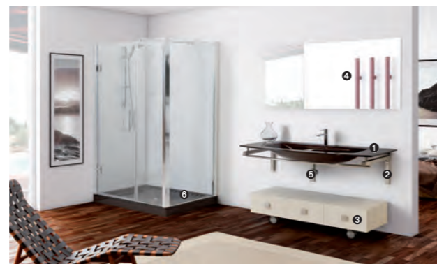
TIFFANY 750 pag 24-25 1_art. BCT-15/130 cm 130x59x1.6h 2_art. BCS-4/130 cm 130x49x2.5h 3_art. MA/21 cm 120x40x31h 4_art. MA20/120 cm 120x2x75h 5_art. S700 cm 50x50 6_art. PO/03A cm 120x80x8.5h