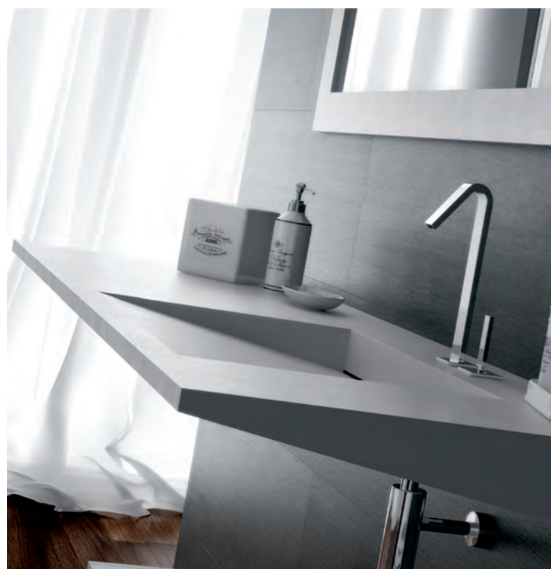
Design Studio Losavio