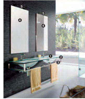
TIFFANY 720 pag 18 1_art. BCT-13/150 cm 150x58x1.6h 2_art. BCS-7 cm 2,5x52,5x16,5h 3_art. BCP-30 cm 150L 4_art. BC-5 cm 50x2x115h 5_art. CAS1 cm 60x9x3H