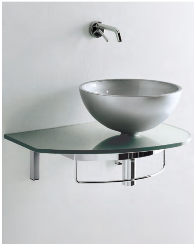
UNIK 4 cm 60x41,5