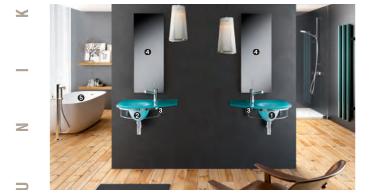
UNIK 2 pag 44-45 1_art. UN/01DX cm 60x41,5x15h 2_art. UN/01 SX cm 60x41,5x15h 3_art. UN/10 cm 40,5x38x15h 4_art. BC-5 cm 50x2x115h 5_art. MT10 cm 170x70x50h