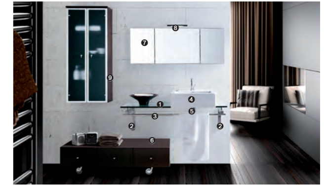
TIFFANY 810 pag 30-31 1_art. TP156 cm 126x36x1.6h 2_art. BCS-5/35 cm 3,5x35x2.8 3_art. BCP-30 cm 120x20 4_art. MA/03 cm 50,5x48x16h 5_art. S700 6_art. MA/21 cm 120x40x31h 7_art. MA22/116 cm 116x2x41h 8_art. ESSENTIAL 4 cm 30x10x5h 9_art. MCZ5B cm 48x31x104h