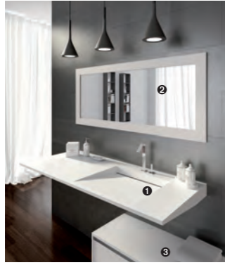
FLOW 05 pag 7 1 art. FLOW cm. 140x51x8 h 2 art. MA21B/140 cm. 140x60 h 3 art. MT305 cm. 140x40x40 h