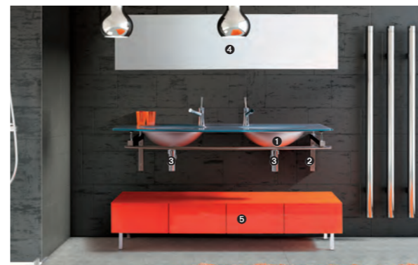
TIFFANY 700 pag 38-39 1_art. BCT-11/160 cm 160x60x1.6h 2_art. BCS-4/160 cm 160x45x2,8h 3_art. S700 4_art. MC23/160 cm 160x2x50h 5_art. MA/22 cm 160x40x31h