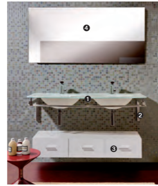
TIFFANY 770 pag 26 1_art. BCT-11/130 cm 130x60x1.6h 2_art. BCS-4/130 cm 130x45x2.8h 3_art. MA/21 cm 120x40x31h 4_art. MA20/130 cm 130x2x75h