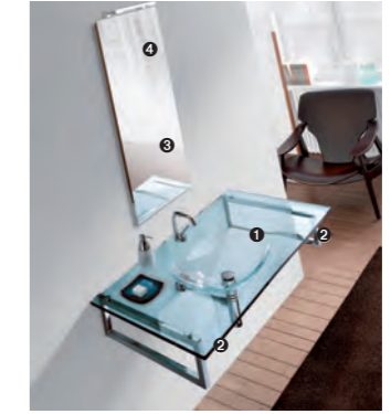
TIFFANY 710 pag 37 1_art. BCT-12/120 cm 120x57,5x1,6h 2_art. BCS-7 cm 52,5x2,5x16h 3_art. BC-5 cm 115x2x50h 4_art. CAS1 cm 30x9x3h