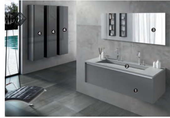
FLOW 30 pag 12-13 1 art. MT110 cm. 120x51x40 h 2 art. FLOW 02 cm. 120x51x8 h 3 art. MA23/119 cm. 119x50 h 4 art. MT707 cm. 38x27x160 h