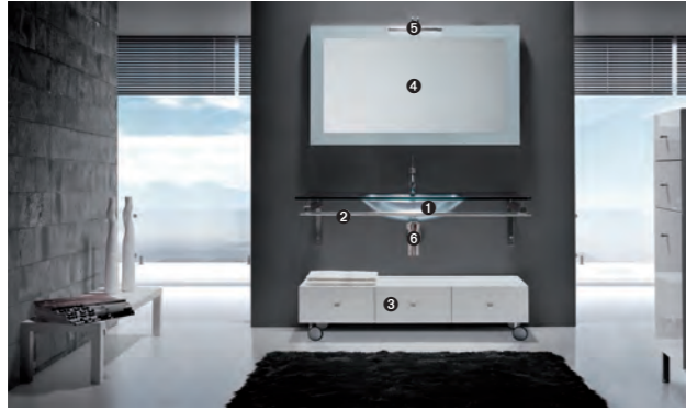
TIFFANY 500 pag 16-17 1_art. BCT-12/120 cm 120x57.5x1.6h 2_art. BCS-4A/120 cm 120x54x2.8h 3_art. MA/21 cm 120x40x31h 4_art. MA21/120 cm 120x2x75h 5_art. GP40 cm 30x9x10h 6_art. S700 cm 50x50