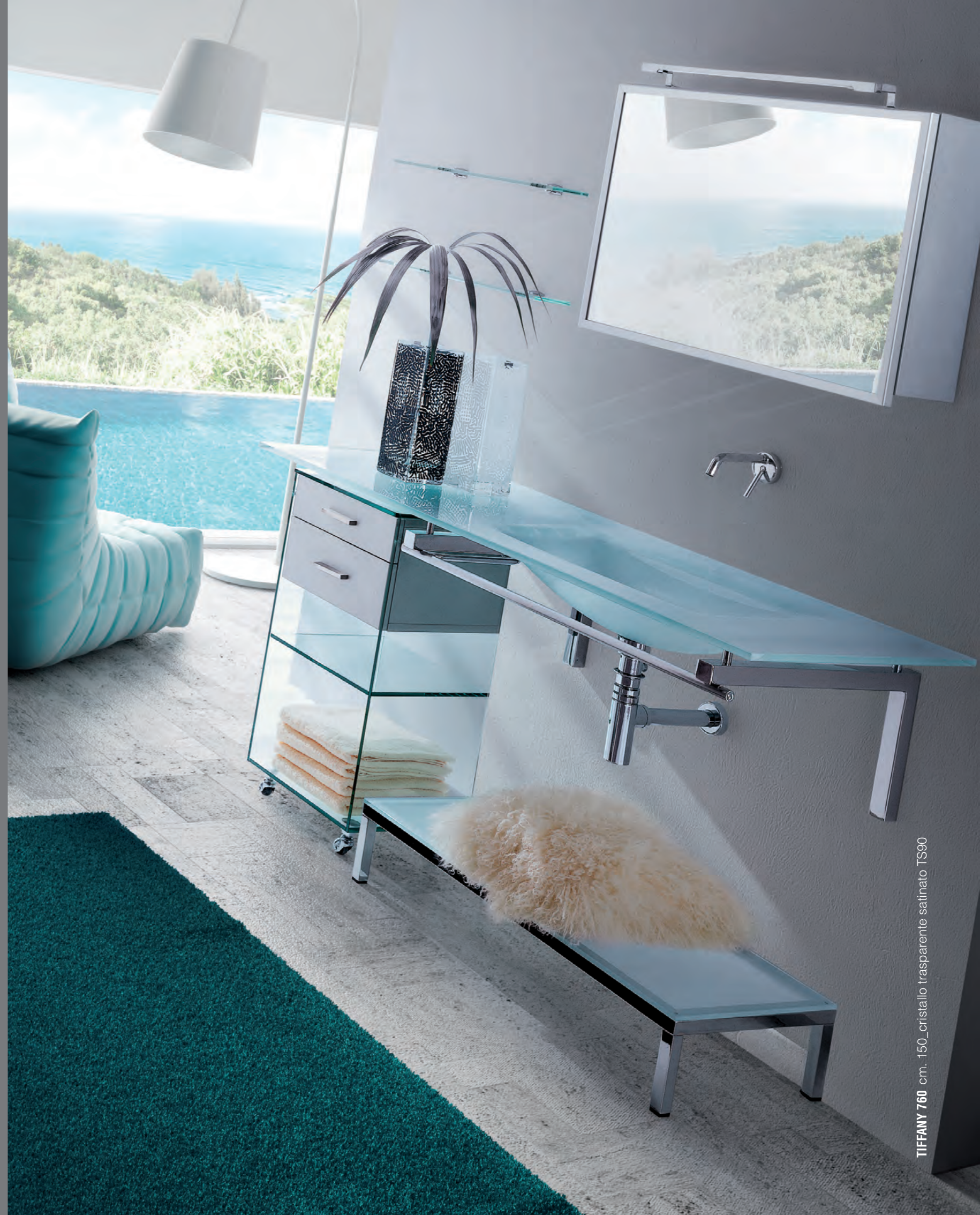
TIFFANY 760 cm. 150_cristallo trasparente satinato TS90