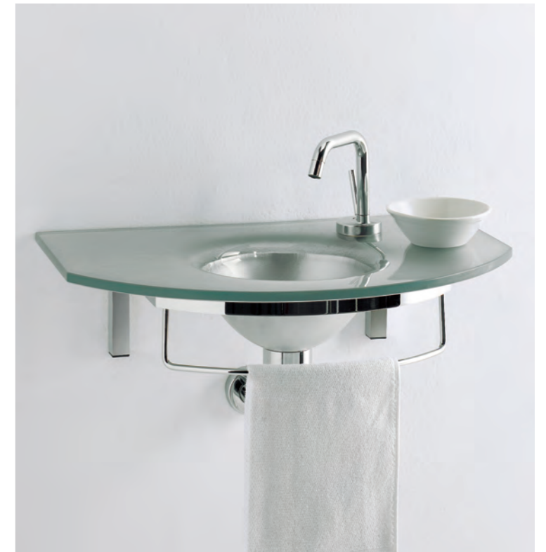
UNIK 5 cm 60x41,5

La collezione Unik si compone di pratiche consolle in cristallo per piccoli spazi. Pensate appositamente per inserirsi in spazi ridotti, propongono colori brillanti e finiture particolari come oro, argento o rame. Nella versione sopra piano o integrata creano soluzioni semplici ed esteticamente soddisfacenti. The Unik collection consists of practical crystal consoles for small spaces. Conceived especially for installation in small spaces, they propose bright colours and special finishes, like gold, silver and copper. The version for installation over the top and the built-in version create simple and aesthetically pleasing solutions. La collezione Unik est constituée de consoles en verre pratiques pour les petits espaces. Spécialement conçues pour s'adapter aux espaces réduits, elles se déclinent dans des coloris brillants et présentent des finitions particulières, comme l'or, l'argent et le cuivre. Dans la version sur plan ou intégrée, elles créent des solutions simples et satisfaisantes au niveau esthétique.