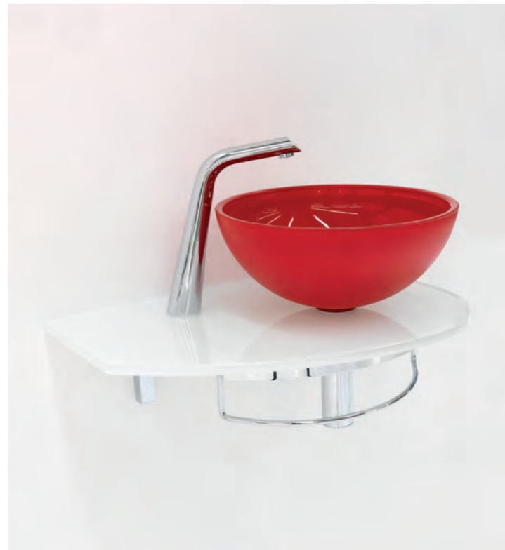
UNIK 9 cm 60x41,5