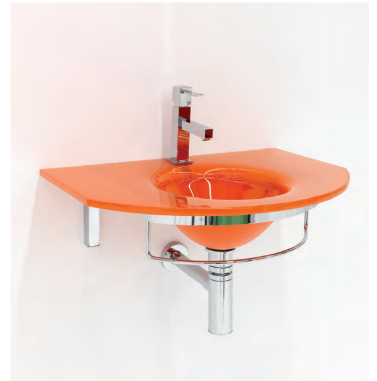
UNIK 7 cm 60x41,5